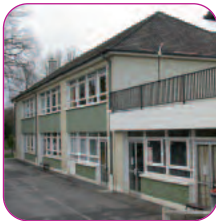
Ecole en milieu industriel