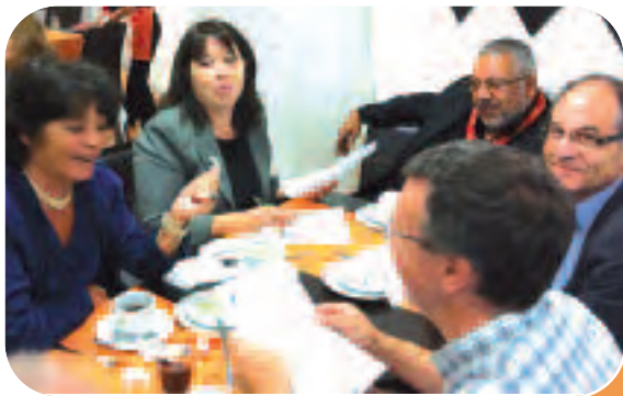
1 ère réunion de bureau dans la bonne humeur