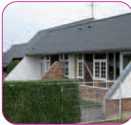
Ecole en site urbain

D'ici la mise en œuvre de cette proposition, le deuxième Plan National Santé Environnement (PNSE) 2009-2013 a proposé une campagne pilote de surveillance de la qualité de l'air intérieur dans les lieux clos ouverts au public, en commençant par les écoles et les crèches (voir "Quel air est-il?" n°71).