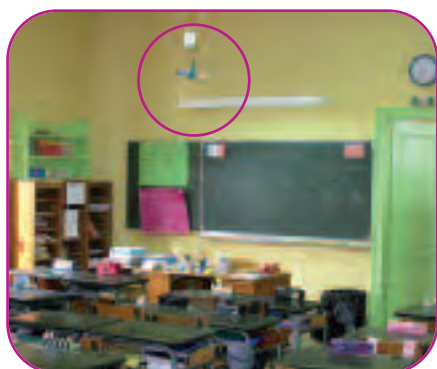
Dispositif de mesure installé en classe

Dans chaque établissement, entre une et huit pièces étaient étudiées (salles de classe ou pièces de vie). Une mesure complémentaire de benzène était réalisée à l'extérieur du bâtiment.