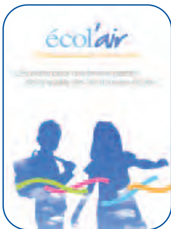
Pochette écol'air et ses outils